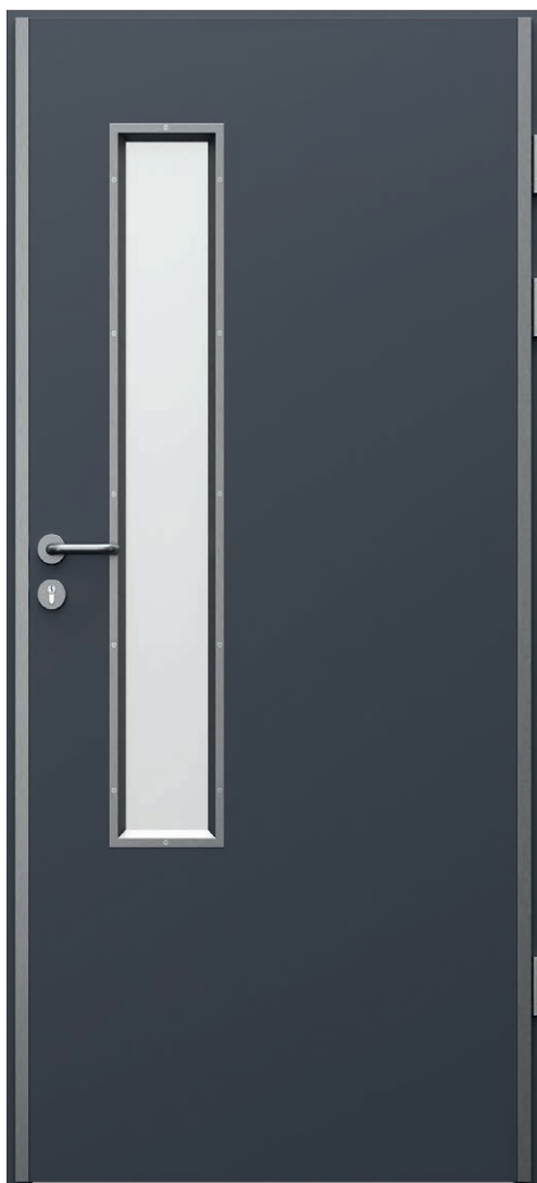
ENDURO 3, Antracit