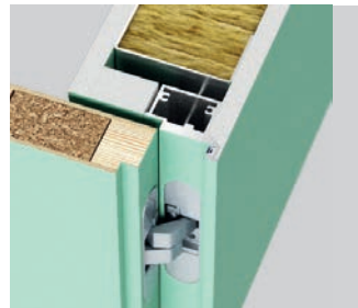
Falț ascuns (deschidere spre interior) – deschidere stânga