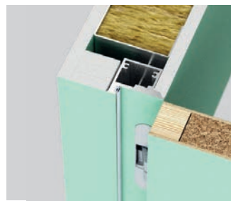
Standard, fără falț (deschidere spre exterior) – deschidere dreapta