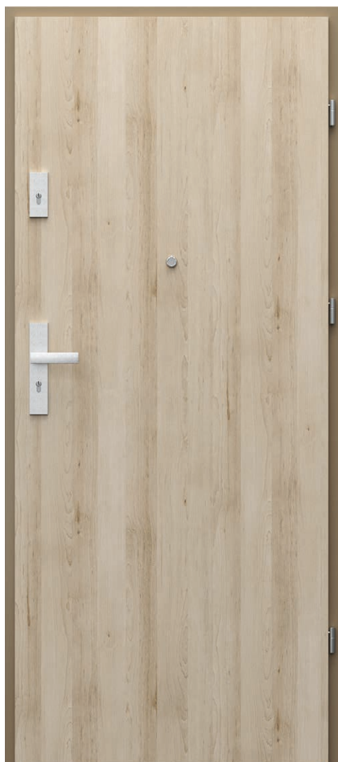
AGAT Plană, Fag Nisipiu, cu toc din oțel

Uși antiefracție AGAT echipate cu broască simplă sau dublă pregătită pentru cilindru având clasa de izolație acustică R_w = 32 dB (32-36 dB).