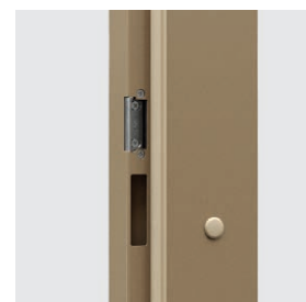
contraplață reglabilă la toc din oțel (opțional)