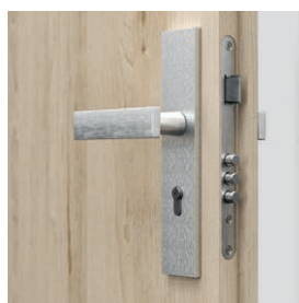
broască cu trei puncte pregătită pentru cilindru – AGAT