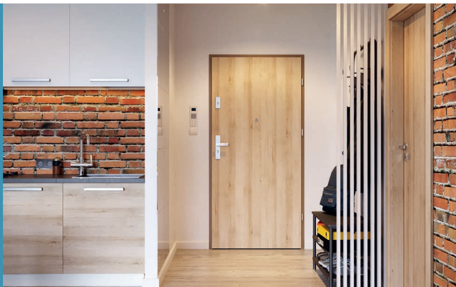
AGAT plană, Fag Nisipiu, cu toc din oțel

Antiefracție RC 2 (Opal) Izolație fonică R_w = 32 dB