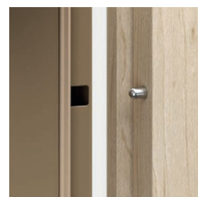
bolțuri pasive antifurt – AGAT, OPAL