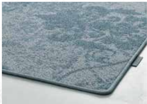
Festonneren / Surjet / Kettelung / Overedging