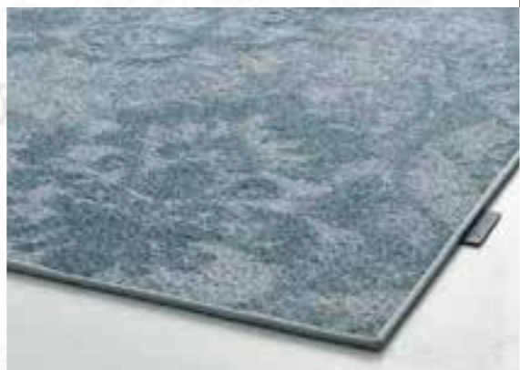
Blind band / Gallon invisible / Blindband / Blind banding

Custom rug In addition to being the perfect wall-to-wall carpeting, Patterns & Shades is also excellently as a custom rug! Use the modern colour combinations and designs to create a personal statement for your interior. As the final touch, finish your custom rug with either blind banding or overedging.